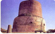
ธัมเมกขสถูป

ทองคำมากมาย ตัวตึกทั้ง ๔ ด้าน ประดับ ประดาด้วยลวดลายอันมหัศจรรย์ รูปไข่มุก ที่ร้อยเป็นสายประดับไว้ที่หนึ่ง"