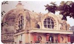
กุสินคร หรือ กุสินารา

สมณะจีนบันทึกไว้ว่า รอบสถูปทั้ง ๘ ช่อง มีพระพุทธรูปทองคำประดิษฐาน อยู่ครบ