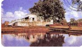
สวนลุมพินีวัน

สถานที่ประสูติของเจ้าชายสิทธัตถะ ในภาพจะมองเห็นเสาทินซึ่งเป็นศิลาจารึกของพระเจ้าอโศกมหาราช อันเป็นจุดที่เจ้าชายสิทธัตถะประสูติ